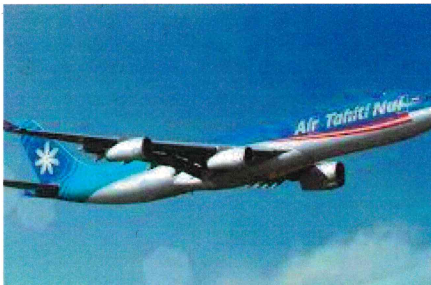
Légende Nemo enim ipsam tatem quia voluptas sit aspernatur.

J'ai choisi Hôtesse de l'air car le métier consiste à toujours accueillir les passagers d'un avion. Etre attentive à leur sécurité, toujours à l'écoute tout au long du voyage. Sourire, courtoisie sont de rigueur dans ce métier. J'aimerais beaucoup voyager dans le monde entier!!!